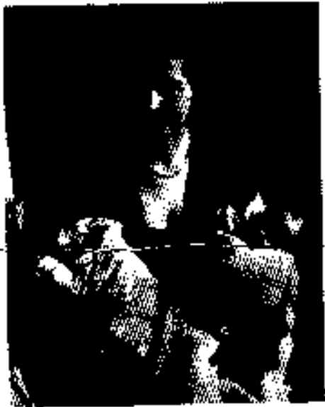
စာပြိုင်ကလေးရှစ်ယောက်၏ မိခင်၊ ၁၉၅၃