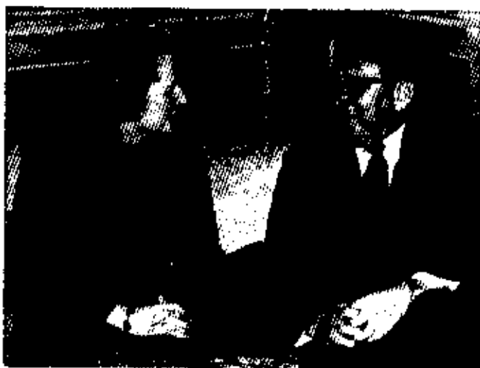
နာမည်ကျော် ဒေါက်တာ တစ်ဆင်းကျားနှင့် ၁၉၇၅