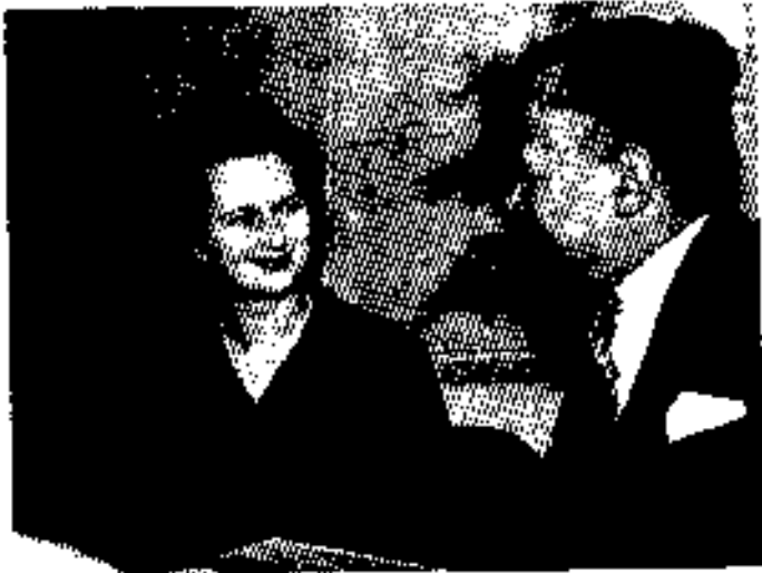
ဒုတိယသန်းကြီးတော် ၁၉၆၀