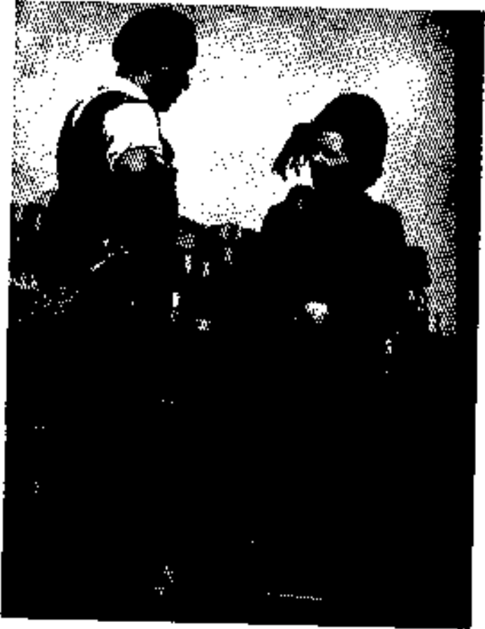
ခဏ္ဍာရအောက်တိုဘာလ တွတ်တော်အမတ်ရွေးတော်ပွဲဝင်ရန် အလုပ်သမားများနှင့် တွေ့ဆုံမဲဆွယ်နေစဉ် (မြို့ဦးထွက်တွင် ရှိနေခဲ့သည်။)