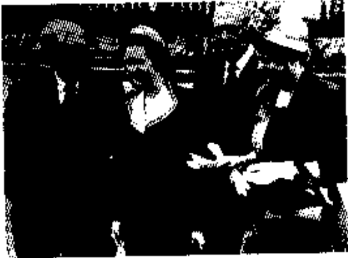
ပထမဆုံးလွှတ်တော်တက်သည့်နေ့၊ ဝါရင့်နိုင်ငံရေးသမားကြီးများက ကြိုဆိုခဲ့ကြသည်။ ၁၉၅၉