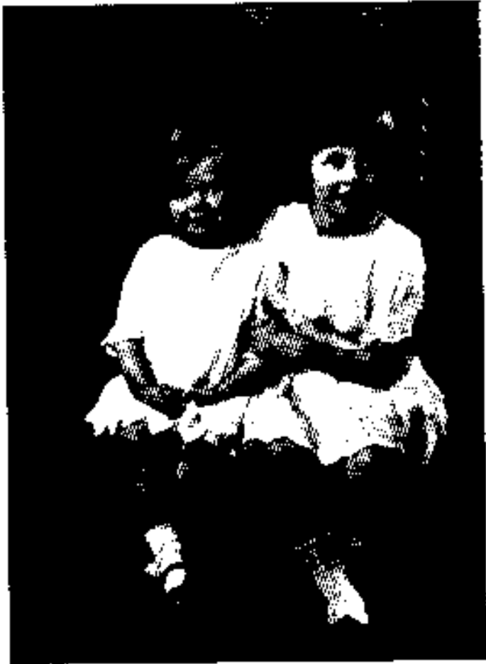
မာတရော်နှင့် မြန်မာ့သမီး ၁၉၂၉