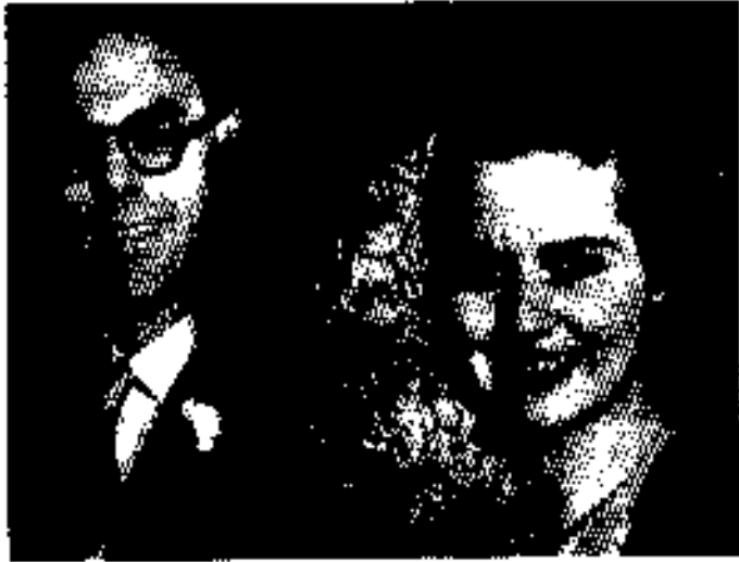
ခင်နစ် သတ်ဆွာနှင့် လက်ထပ်သည့်နေ့၊ ၁၉၅၀