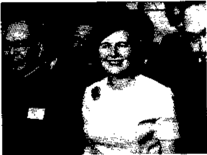
အလွတ်တို့သားများနှင့်၊ ၁၉၇၂