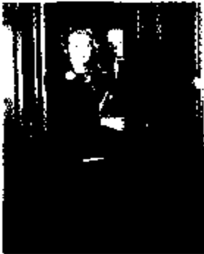
ဂေါ်တီဝေါင်မအောင် အရေးရာချိန် ၁၉၇၅