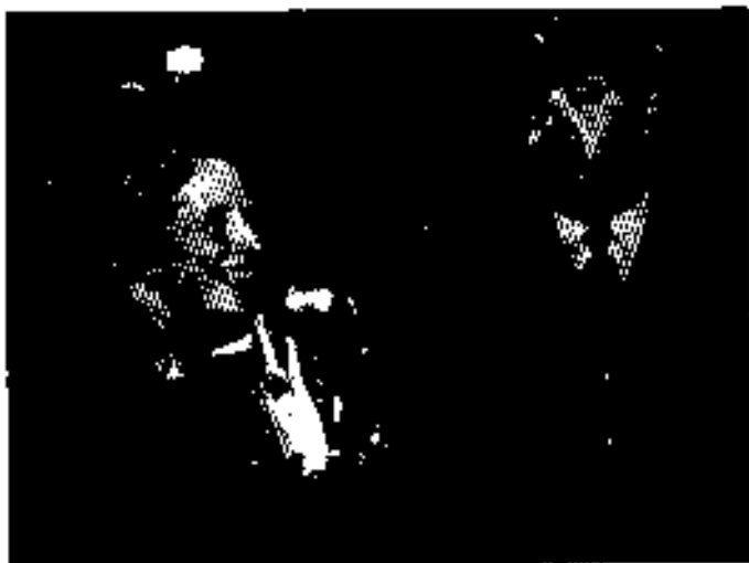
အောင်ပွဲရသည့် မိမိအဖွဲ့မှာ ၁၉၇၅