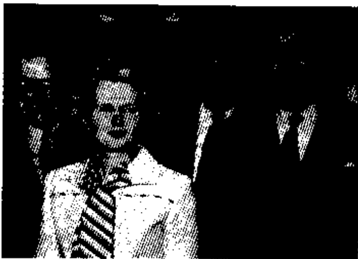
ကွန်ဆာဗေးတစ်ပါတီ ခေါင်းဆောင်အဖြစ်၊ ၁၉၇၅