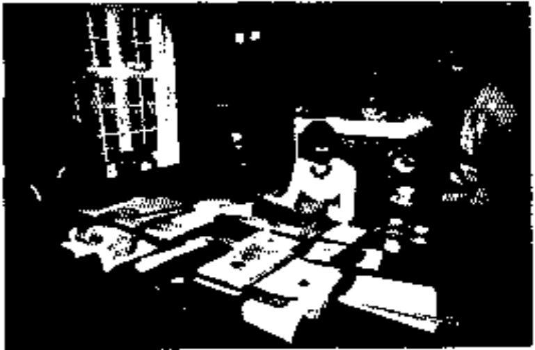
ဒေါ်အေးစု နိုင်ငံရေး ၁၉၇၅