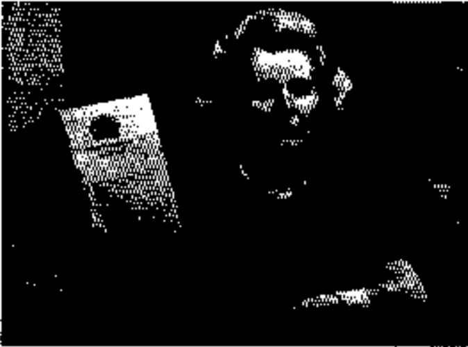
ဘဝလှိုင်ကို ဆေးကုခံရ၍ မနှုတ် ၉ ဘ/၂ (တို့နှစ်ပိုင်းတစ်ပိုင်း) နာမည်ရခဲ့ချိန်၊ ၁၉၇၄