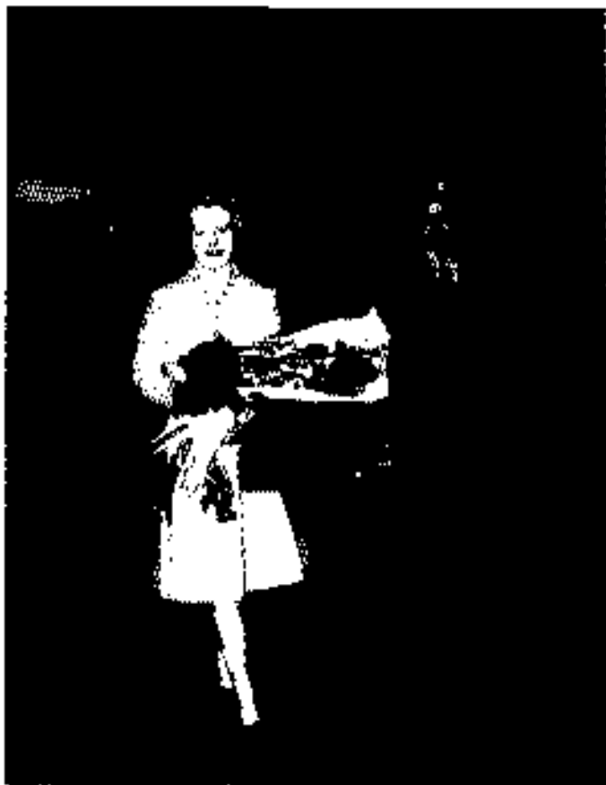
မရီသတ်၏ အချစ်ထော်ဘာစ ၁၉၇၅