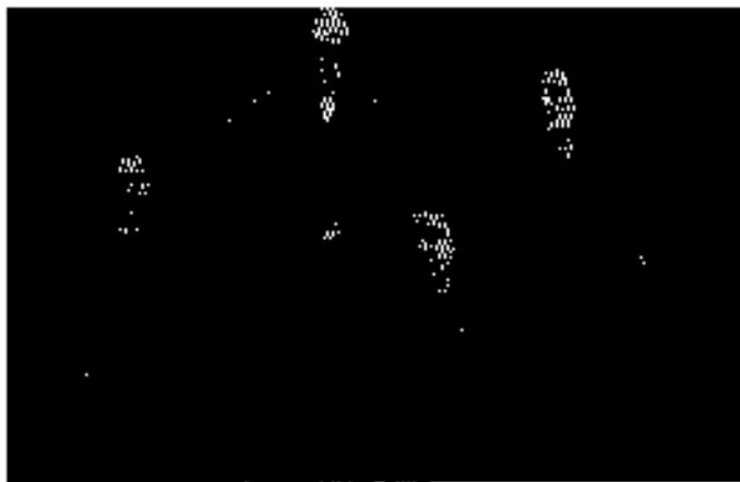
မြို့တော်ဝန်မိသားစု ၁၉၄၅ (မာဂရက်သက်များ၏ အခင်ကြီးသည် ဂရင်သစ်မြို့ကလေး၏ မြို့တော်ဝန်ဖြစ်ခဲ့ဖူးသည်။)