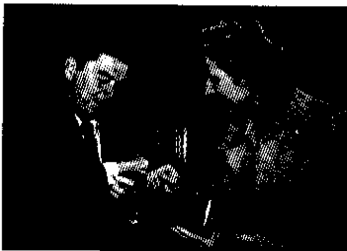
အမေရိကန်သမ္မတ ရေဂင်နှင့် စတင်ရင်းနှီး၊ ၁၉၇၅။